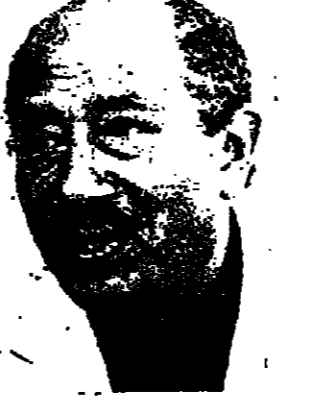
الحكومة . الا ان رئيس الدولة يمثل البلاد بأسرها وجميع شعب اسرائيل ، ويهدهد السنة دعاه الرئيس السادات ليحل ضيفا على مصر . ولقد كان من الحكمة ان اشارت حكومة اسرائيل على الرئيس نافون يقول الدعوة .

لقد كانت ايامه حكيمة من جانب الرئيس محمد انور السادات عندما الرئيس الاسرائيلي اسحق نافون لزيارة مصر رسمية . ان الرئيس السادات ليس رئيس دولة نحسب ، وانما هو يتولى في نفس الوقت اعلى منصب تنفيذي في بلاده ، مثله في ذلك مثل الرئيس الجزائري ، والرئيس نافون هو نفسه رئيس دولة اسرائيل ، ويقوم بدور شبه بالذات الذي تقوم به ملكة كثرنا او ملك السويد . اما الذي يتولى اعلى منصب تنفيذي في البلاد فهو رئيس